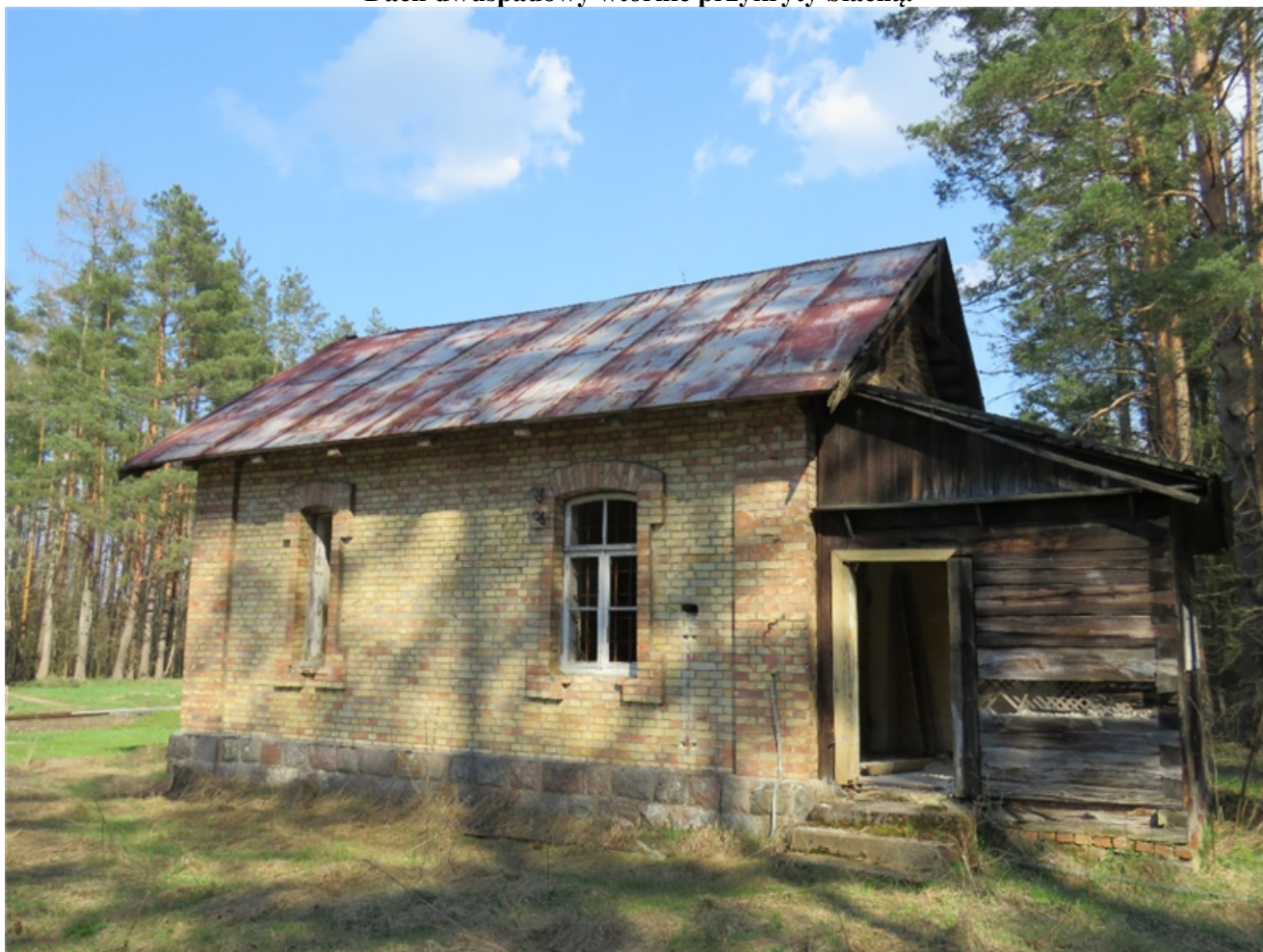
Dach dwuspadowy wtórnie przykryty blachą.